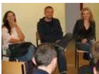
Goście Festiwalu Filmów Młodzieżowych STOP w 2009 r.