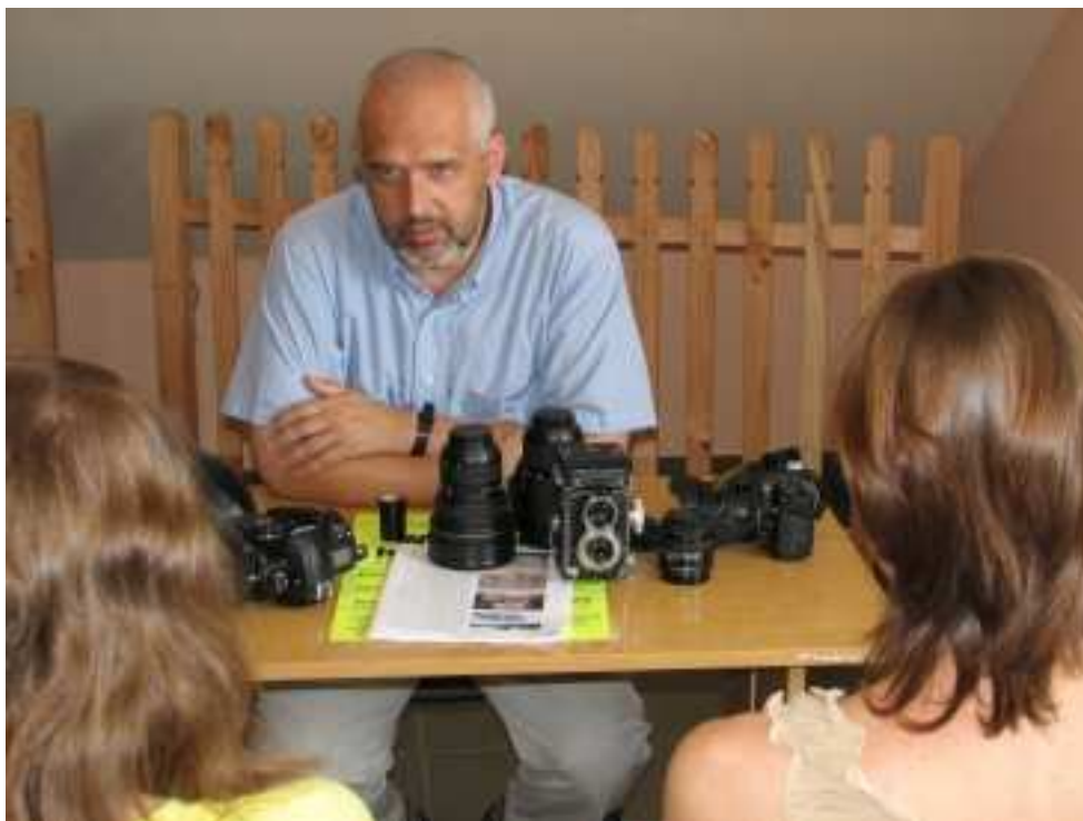
Warsztaty fotograficzne i filmowe prowadzone przez pana Tadeusza Koniarza