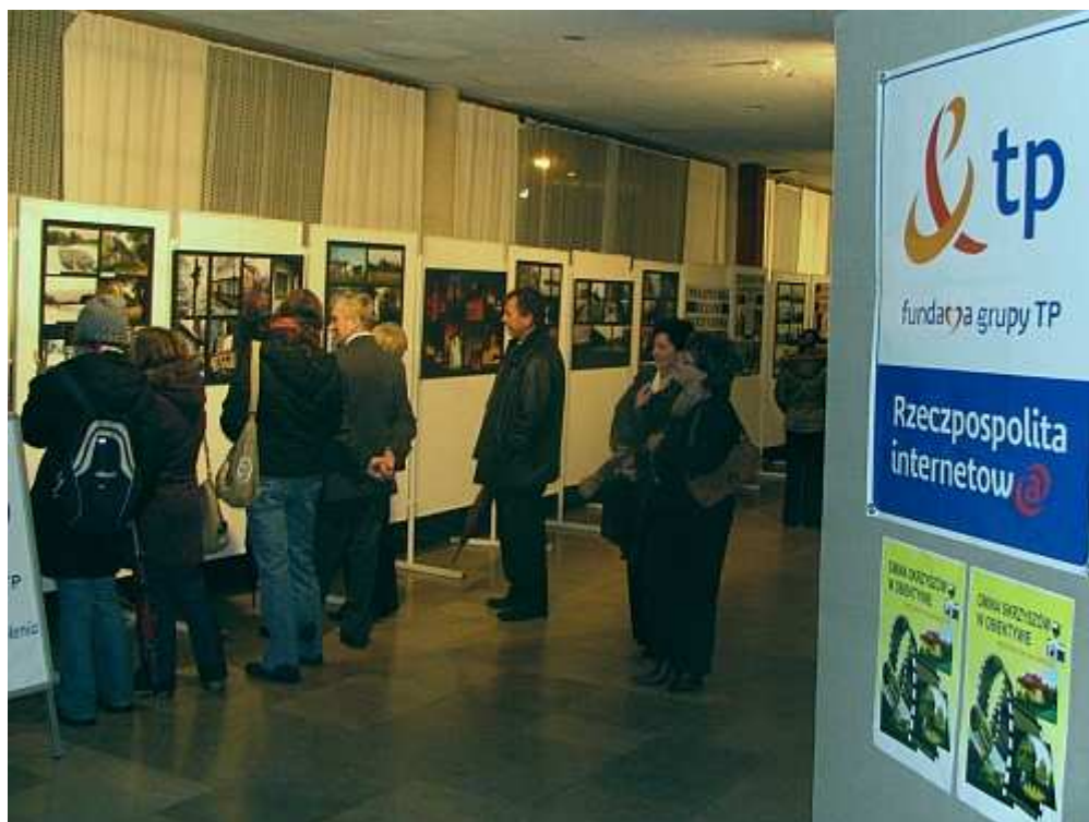
Ekspozycja „Gmina Skrzyszów w obiektywie” w holu Mościckiej Fundacji Kultury

GCKiB współpracuje ze szkołami, przedszkolami, instytucjami i organizacjami pozarządowymi nie tylko z terenu gminy Skrzyszów.